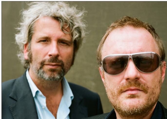
Stermann & Grisseemann – der Titel ist Programm: „Gags, Gags, Gags“.