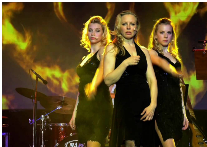
Vorstadt-Weib Nina Proll wird das Publikum mit ihren Vorstadt-Liedern begeistern. Ein Konzert der Extra-Klasse.