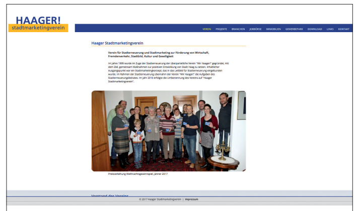
Die neue Homepage des Haager Stadtmarketing-Vereins. Mit Job- und Immobilien-Börse.

ben hier die Möglichkeit, ihr aktuelles Jobangebot bekannt zu machen und zu bewerben.