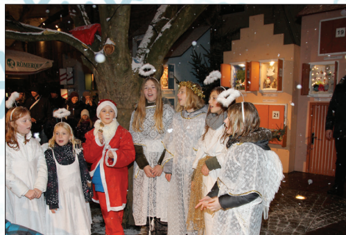
Ein besonderes Highlight für Jung und Alt ist das Öffnen der Fenster im Haager Adventdorf.

Traditionell findet am Samstag Abend um 19 Uhr die Sportlermesse in der Stadtpfarrkirche statt. Gestaltet wird die Messe von der Gruppe „Vocalistic“. Und natürlich wird – wie jeden Tag im Advent – auch an diesem Wochenende um jeweils 17 Uhr wieder ein Fensterchen im Adventdorf geöffnet.