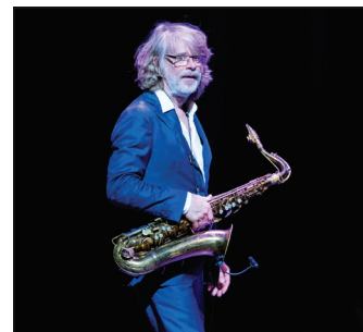
„Helge Schneider“