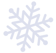
Die Haager Einkaufsgutscheine: ein heißer Geschenk-Tipp für Weihnachten.