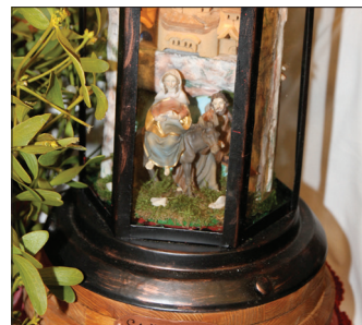
Neben Kunsthandwerkmarkt und dem beliebten Standmarkt (oben) ist eine umfangreiche Krippenausstellung zu bestaunen.